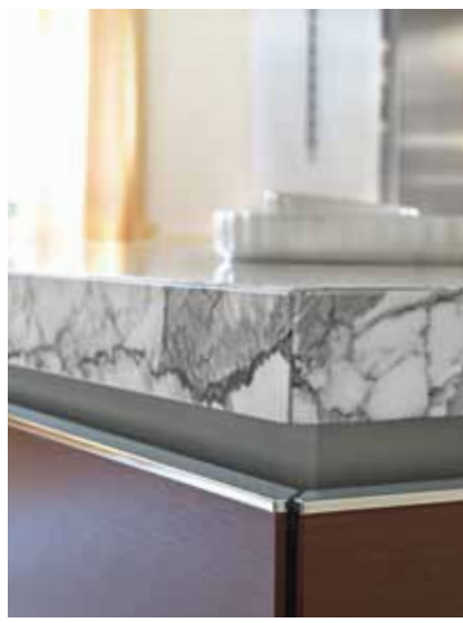
»Library«: Die Küche mit der Atmosphäre einer Bibliothek. Ob klassisch mit Kochutensilien oder ungewöhnlich mit Büchern und Accessoires bestückt: Der Übergang zwischen Kochen und Wohnen ist fließend. Und der Raum für Ihre Persönlichkeit sehr groß.